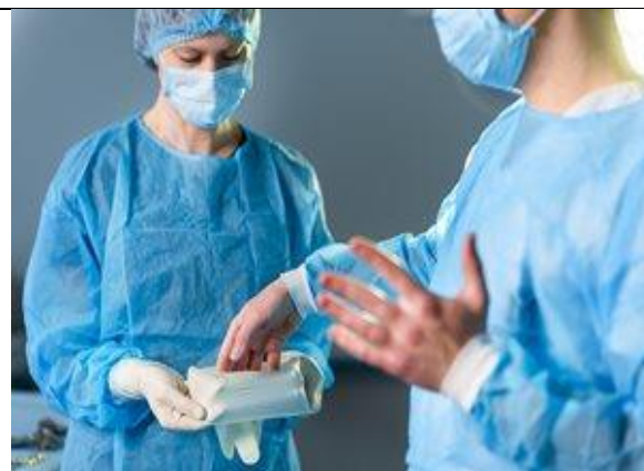
دادن دستکش به جراح (دست غالب)