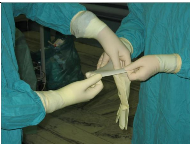
دادن دستکش به جراح (دست غیر غالب)